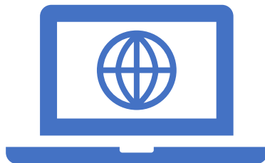
Tool zur Simulation von Automaten u.Ä.