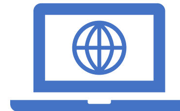
Kurse zur visuellen Programmierung